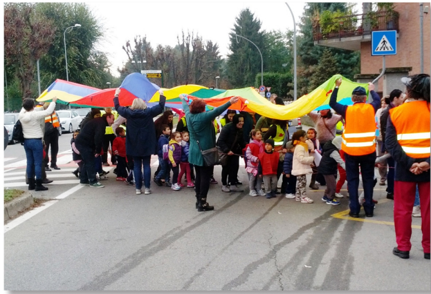
settimana mobilità sostenibile