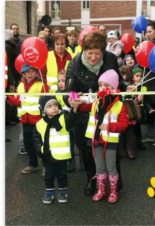
Inaugurazione Via Regis