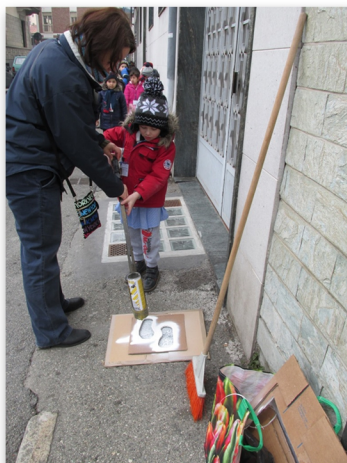
disegnamo i piedini...