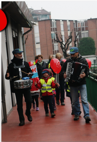
Faber Teater per il Bambi