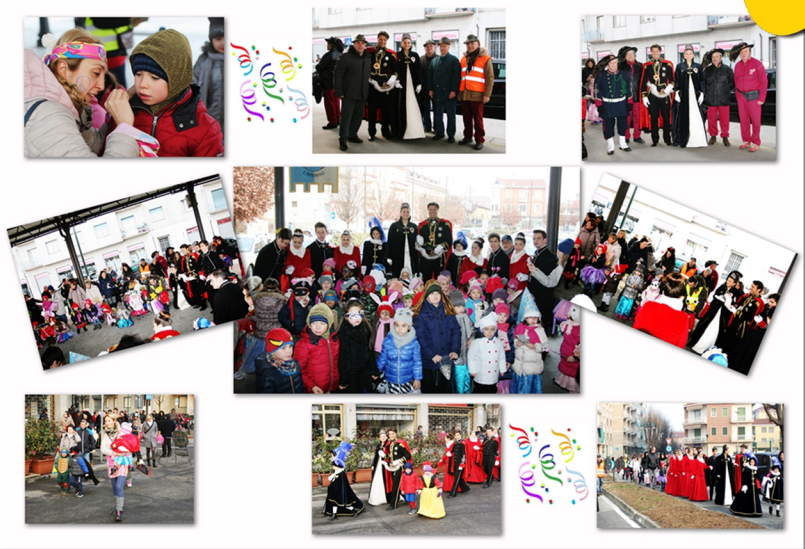
Carnevale con la Corte