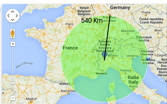
Km percorsi dai ns bimbi nel mondo..