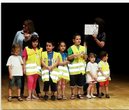
premiazione "a scuola Camminando"